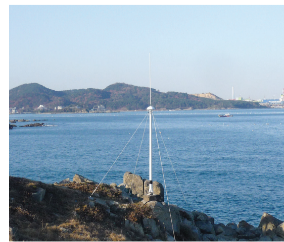
해수 유동 관측소

국가 해양 관측망은 우리나라 관할 해역을 효과적으로 관리하기 위하여 운영하고 있는 관측망으로, 조위 관측소, 해양 관측소, 해양 관측 부이, 해수 유동 관측소, 종합 해양 과학 기지로 구성된다. 국가 해양 관측망을 통하여 관측되는 자료는 조위, 수온, 염분, 풍향, 풍속, 유향, 유속, 파고 등이다. 국가 해양 관측망을 통한 해양 관측 자료의 수집과 분석은 우리나라 관할 해역에 대한 이해를 높이고, 해양 이용, 개발, 보전, 기후 변화, 해양 재해와 관련된 국가적 역량 향상에 기여하고 있다. 그리고 이와 같은 국가 해양 관측망의 구축과 운영은 해양 방어력 증강에 필요한 해양 감시 인프라 구축의 의미도 가지고 있다. 국가 해양 관측망을 통해 수집된 자료는 국가 해양 관측 정보(KOOPS: Korea Ocean Observing and Forecasting System)를 통하여 인터넷상에서 공개되고 있다. 관측 자료를 분석한 결과는 뉴스레터, 연간 백서, 특이 현상 보고서 등으로 제작되어 200여 관련 기관에 제공된다.