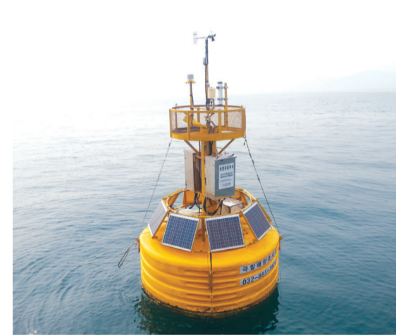
해양 관측 부이