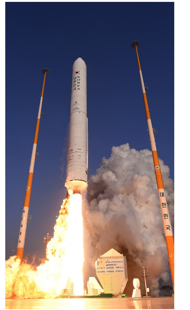
한국형 발사체 누리호 개발을 위한 엔진 시험 발사체 발사